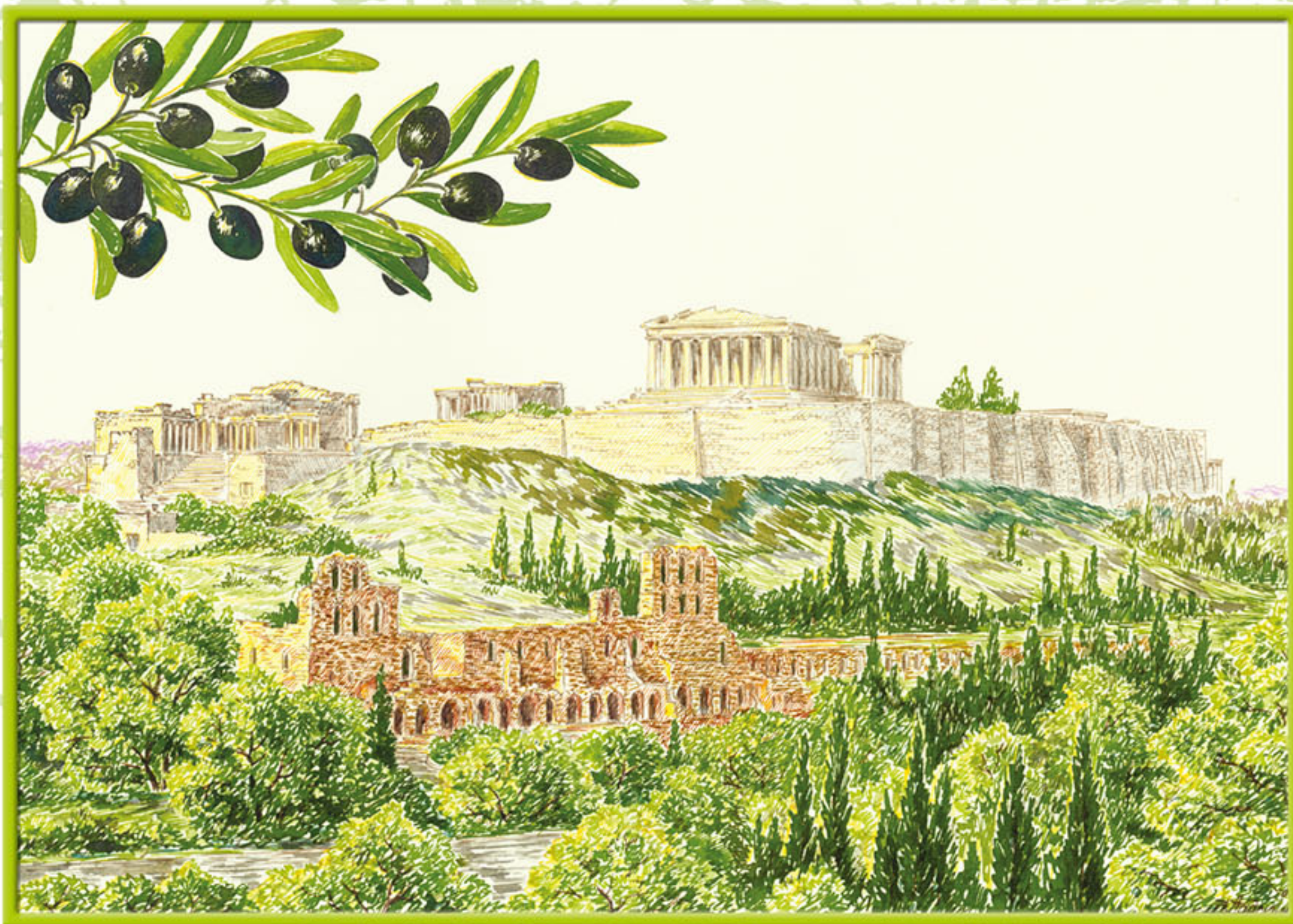
Греция. Афинский Акрополь.

Оливки называют плодами усердия и любви, т.к. чтобы сделать их съедобными, приходится несколько месяцев вымачивать их плоды в специальном соляном растворе (свежие оливки страшно горькие). Согласно греческому мифу, Афина подарила афинянам священное дерево - маслину.