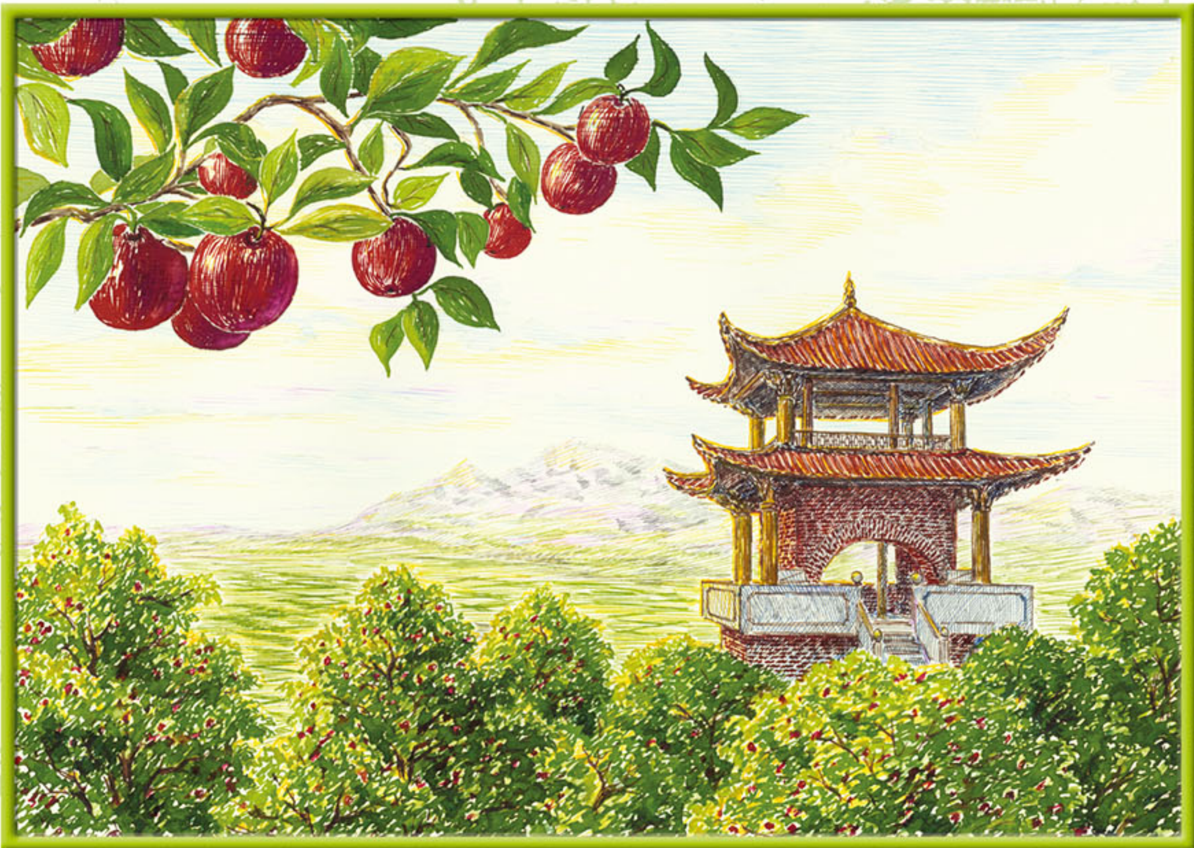
Китай. Пагода "Золотого дракона".

В России яблоком называли "державу", символ Мира. Яблоко - плод древа жизни, символизирующий саму жизнь. Видимо в связи с этим во многих мистических традициях, в том числе и в Китае, яблоко используют как предмет для предуготовления к медитации. Наверное, изначально это делалось не только в угоду символике. Ведь яблоко содержит полезные вещества, стабилизирующие обмен веществ в организме, в древней медицине яблоки считались успокаивающим средством.