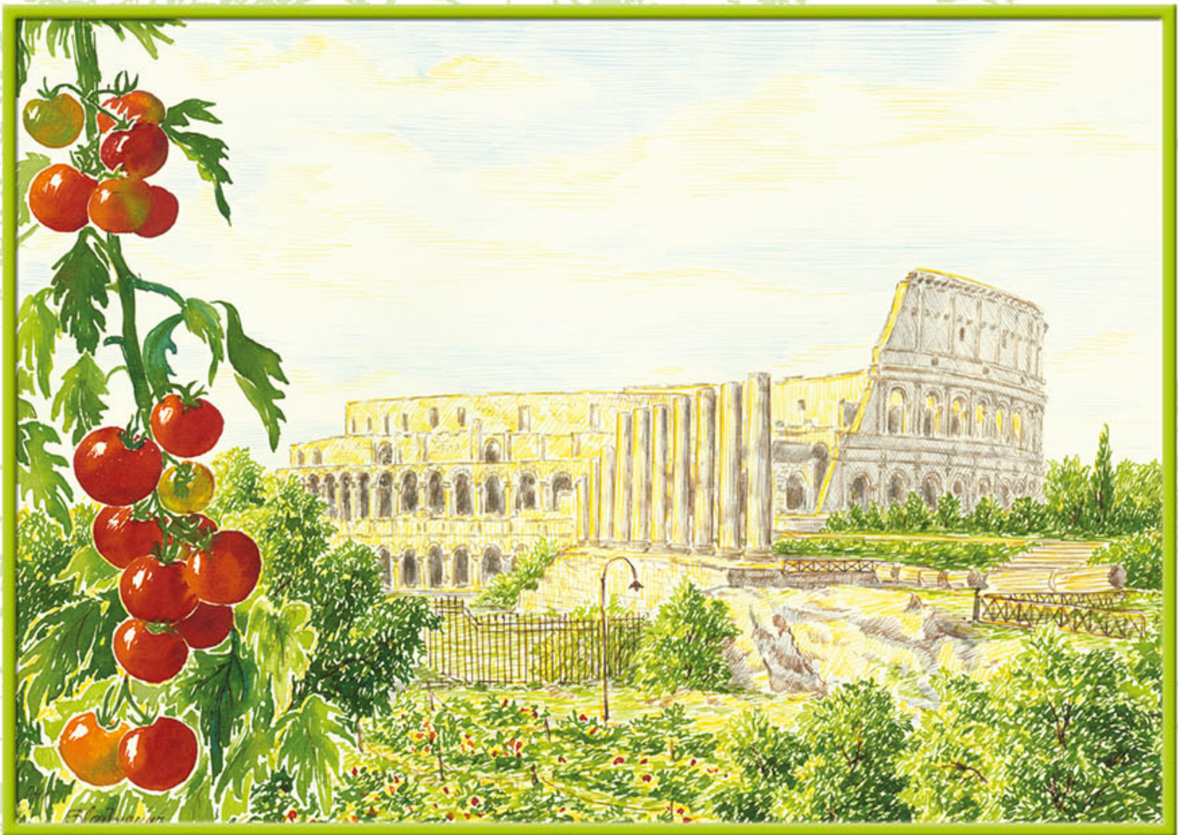
Рим. Форум и Амфитеатр Флавиев (Колизей).