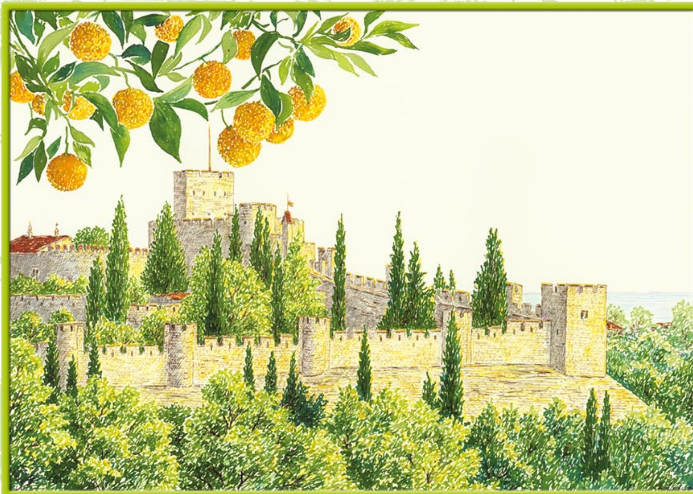
Португалия. Монастырь Христа в Томаре.

Мандарины и апельсины - один из символов российского Нового года. Эти фрукты, традиционно поставлявшиеся в СССР из Испании, Португалии и Марокко, вызревают в этих странах поздней осенью и как раз к новому году попадали к нашему столу. Сегодня свежие апельсины, растущие в субтропическом поясе, можно есть круглый год, но мы по инерции считаем те - декабрьские, "родом из детства", вкуснее.