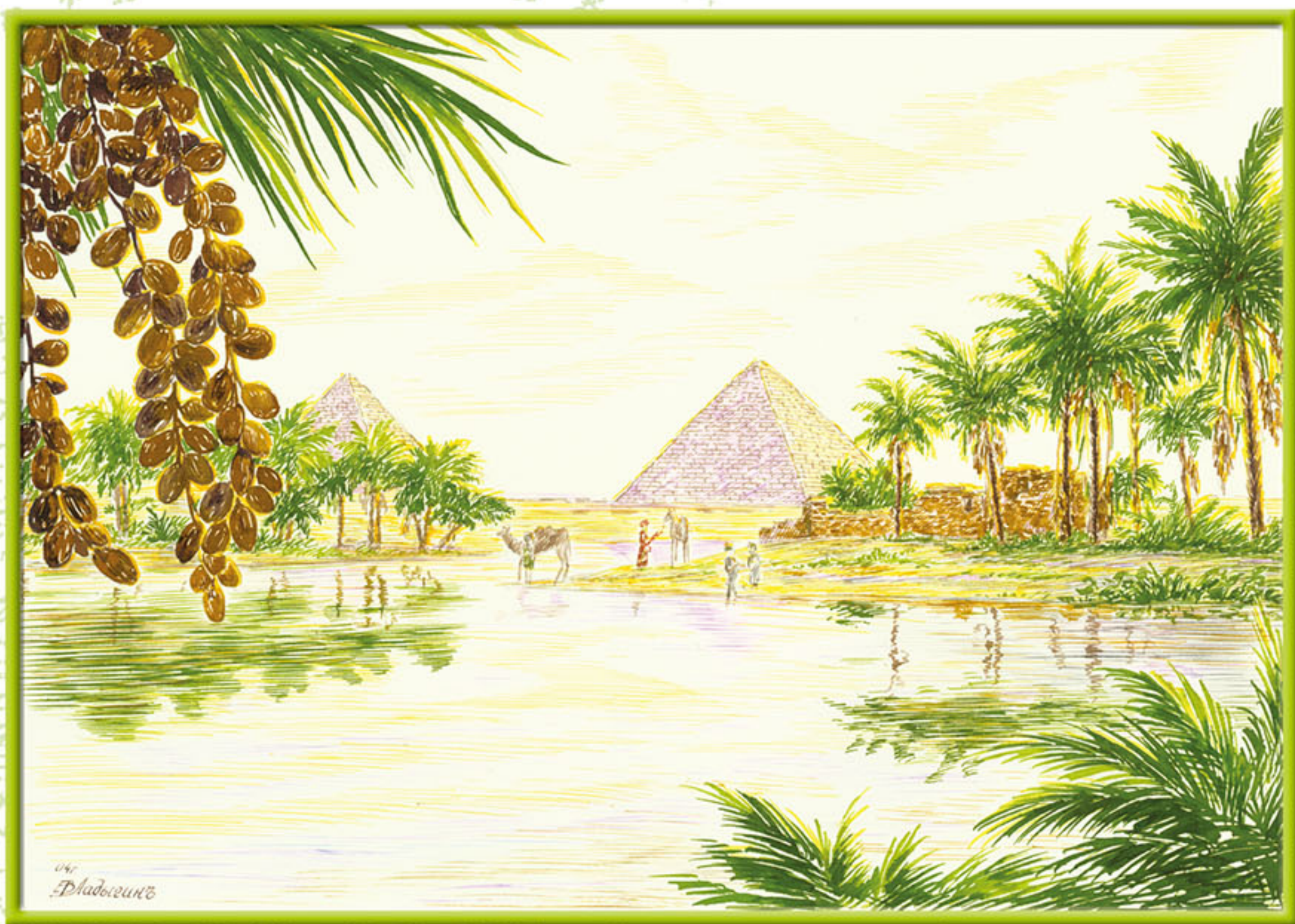
Египет. Финиковые пальмы в долине Нила.

Финиковую пальму называют "благословенным деревом". В арабских странах, где финики - основа рациона, умеют готовить из них не менее 100 блюд, даже хлеб. Финик - один из самых полезных для здоровья плодов. Врачи говорят, что если съедать в день по 2 - 3 финика, то можно не бояться желудочных заболеваний, финиковая клетчатка выводит вредные вещества, в том числе и канцерогены. Не даром египтяне почти не знают проблем с пищеварением.