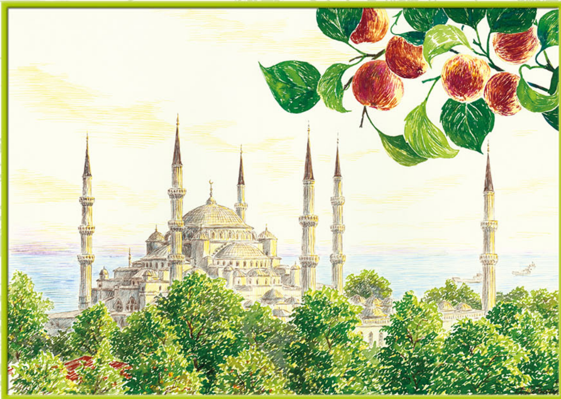
Константинополь (Стамбул). Пятничная мечеть.

Происхождение персика неизвестно, хотя название Persica указывает на Персию (Иран). В старину на Востоке считали, что лучшая вода для заваривания чая - та, что стекла с лепестков цветка персика, когда на них тает запоздалый весенний снег. С нежным, сочным и прекрасным фруктом из садов Константинополя сравнивали турецкие философы красивых, "аппетитных" девушек. Персик, словно девушка, лишь нежное обращение позволяет сохранить его свежесть и красоту.