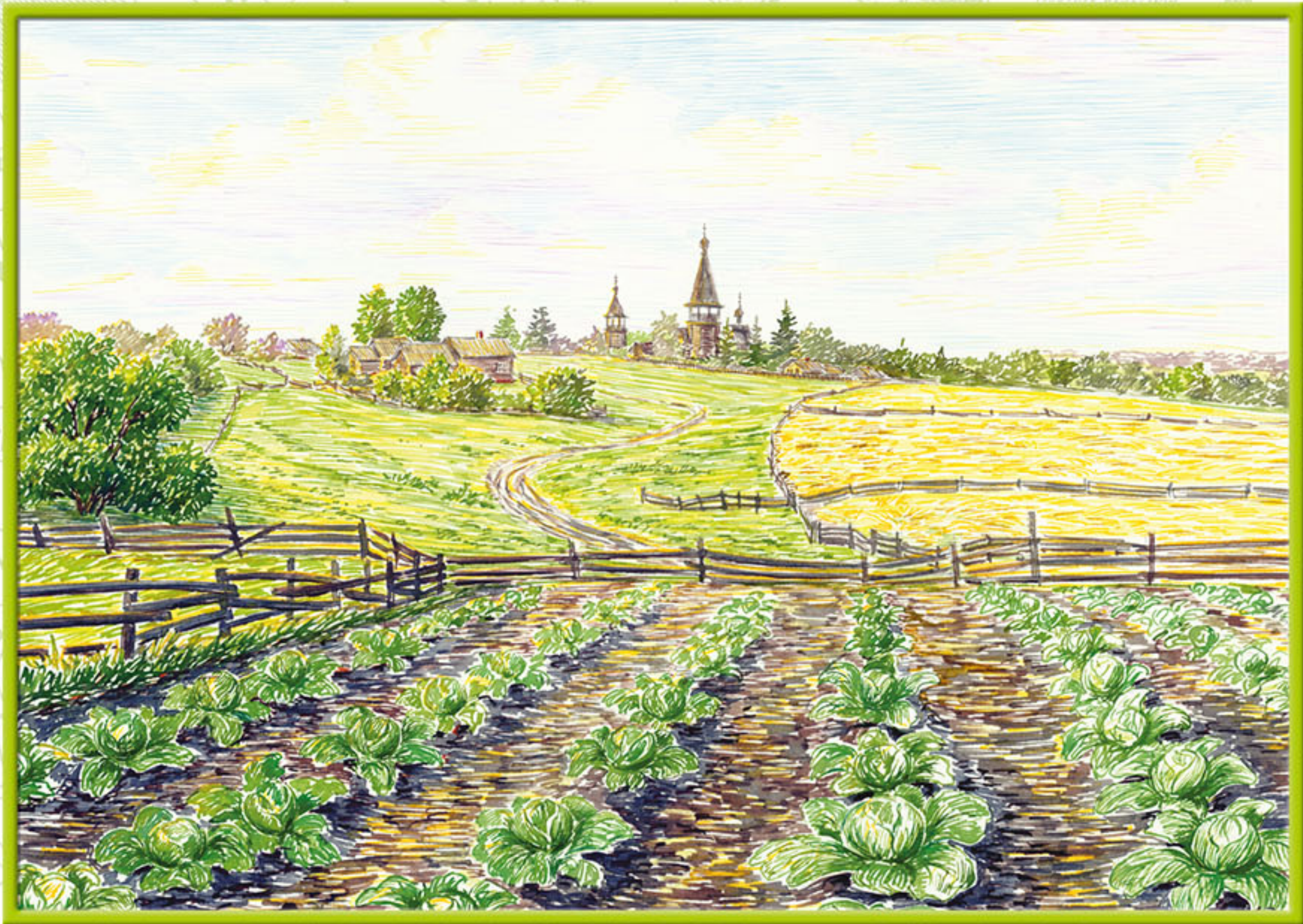
Русские просторы. Сельский огород.

Какой овощ или фрукт можно назвать типично русским? Наверное, это лишь капуста, которую у нас едят во всех видах. Свежую - в салатах, вареную в щах, печеную в пироговых начинках и жареную в селянках, а еще квашеную, моченую ... Капуста, особенно свежая, - кладезь витаминов и микроэлементов. Поэтому, возможно, наши предки и были богатырями, ведь "щи да каша, была пища наша".