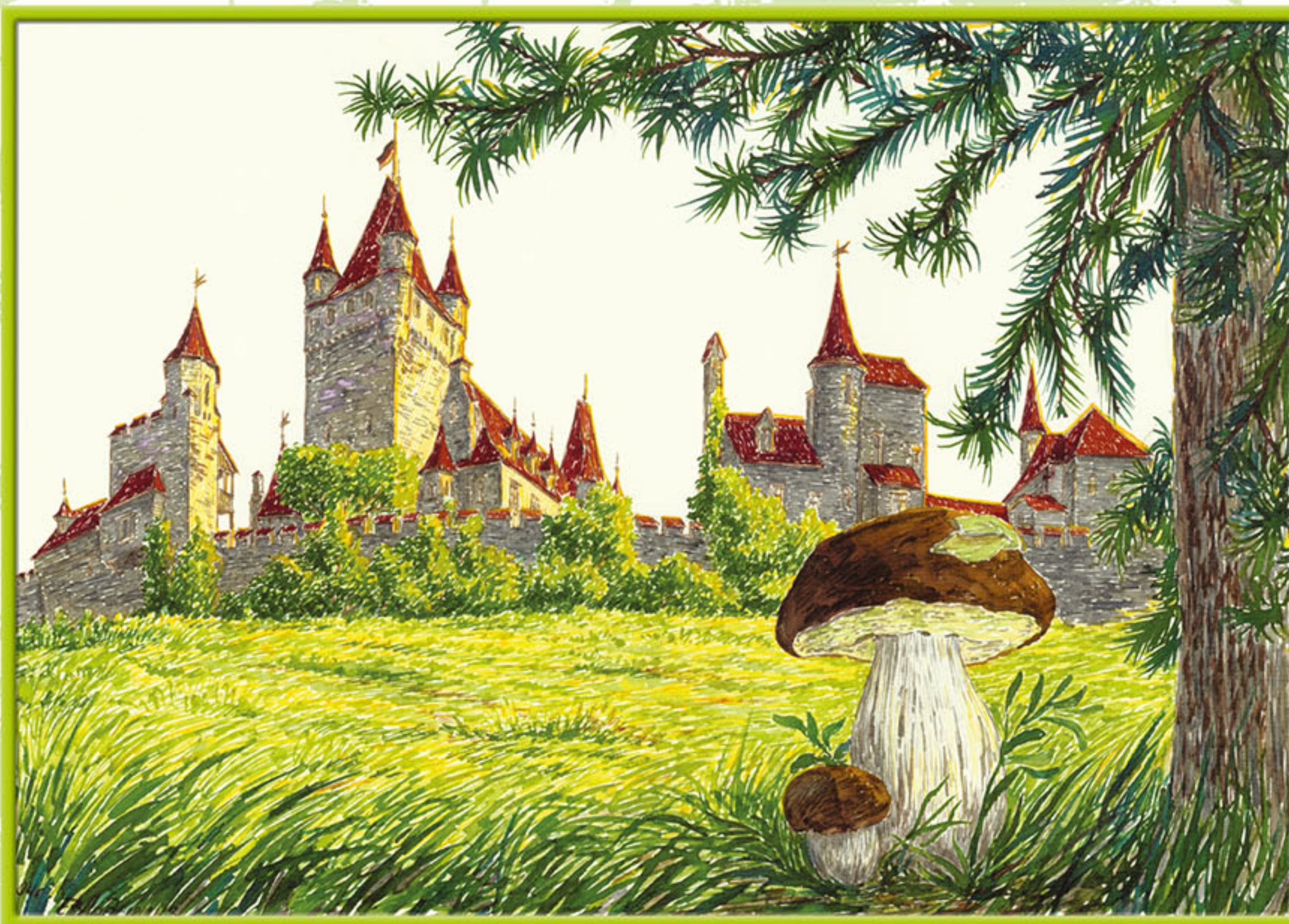
Германия. Замок Кохен.

Когда-то, Германия была страной лесов, в чащах которых, росли грибы, из-за своих странностей породившие множество казусов. В немецком "Травнике" конца XVI века указывалось: "Грибы называются детьми богов, ибо рождаются они без семян, не так, как другие". Сегодня грибы выращивают на гидропонных плантациях, спрятанных глубоко под землей, словно оживив германские сказки о гномах, день и ночь трудящихся не видя света.